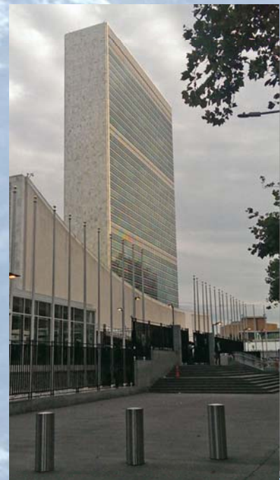
UN Headquarters, New York

Un certain nombre d'items à l'ordre du jour de l'UN-GGIM-5 intéressaient directement les Etats membres de l'OHI, particulièrement en ce qui concerne la contribution de données et services hydrographiques aux infrastructures de données spatiales nationales et régionales. L'« agenda 2030 des NU pour le développement durable » qui sous-tendait