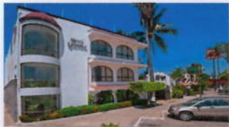
Hotel La Pergola

Through this I extend the low season rates for 2014.