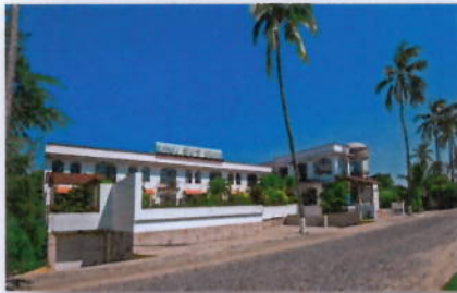
Hotel Pez Vela